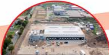
Raben Polska sp. z o.o., ul. Wawelska 111

W centrum miasta Rank Progress realizuje galerię handlową o powierzchni najmu 24 tys. m 2 . Ulokowano w niej hipermarket spożywczy, centrum fitness, market budowlany oraz sieciowe butiki a także 540 miejsc parkingowych.