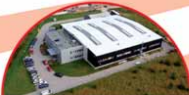
Qubiqa Sp. z o.o., ul. Ceramiczna 30

Firma polsko szwajcarska producent izolacji sanitarnych. Spółka jest partnerem firm międzynarodowych, współpracująca m.in. ze spółką Gebelit Polska. Zatrudnia kilkadziesięciu osób w tym także osoby niepełnosprawne.