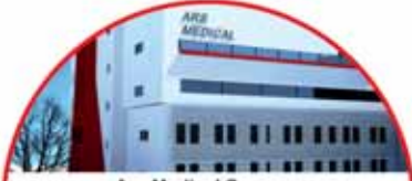
Ars Medical Sp. z o.o. Al. Wojska Polskiego 43

Na rynku piłskim działają od ponad 20 lat, dynamiczny rozwój można odnotować szczególnie w ostatnich dwóch latach. Zatrudnienie kilkudziesięciu osób.