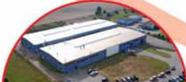
Colours Factory Sp. z o.o. ul. Wypoczynkowa 13

Prowadzone prace inwestycyjne dotyczą rozbudowy budynku głównego Ars Medical oraz poszerzenia oferty placówki o chirurgię ogólną i onkologiczną oraz kardiografię, prowadzoną w nowoczesnych salach operacyjno-zabiegowych.