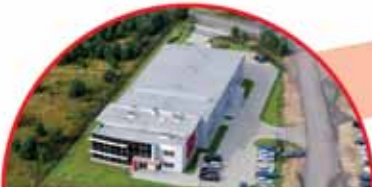
Swisspol Sp. z o.o., ul. Żwirowa 1

W grudniu 2012 roku firma Raben Polska, która w Piłce ma już swój oddział od kilkunastu lat, przeniosła swoją siedzibę na ulicę Wawelską. Zatrudnienie początkowe 4 osoby, dziś ponad 30 osób.