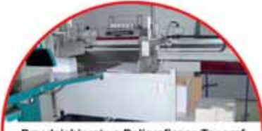
Przedsiębiorstwo Poligraficzne Tongraf ul. Pilotów 7

Firma na piłskim rynku istnieje od 1990 r. Firma zatrudnia kilkudziesięciu pracowników i posiada status Zakładu Pracy Chronionej, a od 2007 roku pracuje zgodnie z Systemem Zarządzania Jakością ISO 9001.