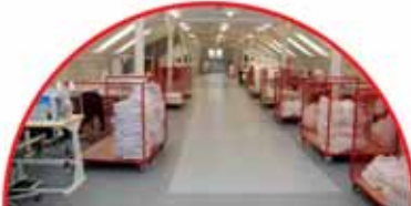
Topi, ul. Lotnicza 8

Firma na piłskim rynku istnieje od 1990 r. Firma zatrudnia kilkudziesięciu pracowników i posiada status Zakładu Pracy Chronionej, a od 2007 roku pracuje zgodnie z Systemem Zarządzania Jakością ISO 9001.