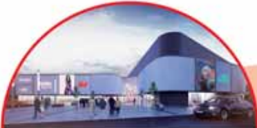
Galeria Piła przy ul. Zygmunta Starego

To jedna z wiodących w Polsce drukarni materiałów i wydawnictw reklamowych, plasująca się w ścisłej czołówce największych polskich firm sektora poligraficznego i zatrudniająca ponad 200 osób.